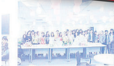
Triển lãm Tri ân ngày lễ chị em phụ nữ