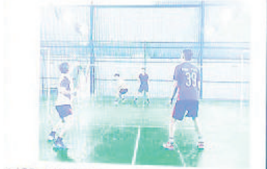
Giải đấu bóng đá ICT hàng năm